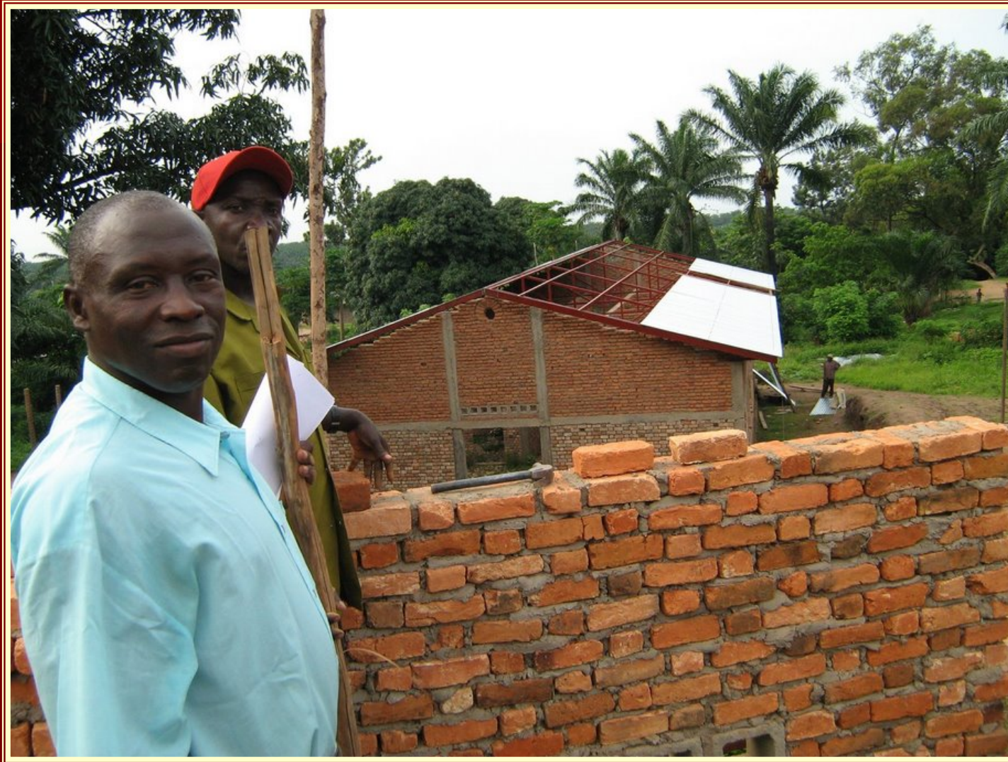
Der Bauleiter – stolz wie Oskar!